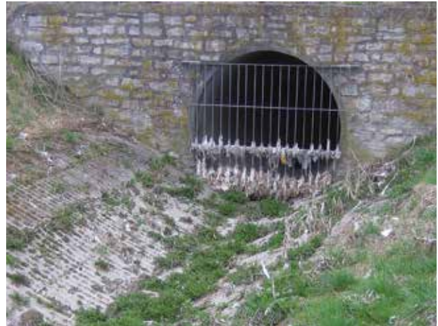
Typisches Bild eines Regenauslassbauwerkes ohne Grobstoffrückhalt nach einem Entlastungsereignis.

Bei starken Regenfällen gelangen in der Mischkanalisation über Entlastungsbauwerke an Regenüberläufen und Regenbecken oftmals erhebliche Mengen an Schwimm- und Schwebstoffen in die Gewässer. Dieser Feststoffaustrag kann durch den zusätzlichen Einbau von Tauchwänden unzureichend verhindert werden. Die ausgetragenen Stoffe wie Hygieneartikel, Toilettenpapier, Fäkalien, Plastikfolien etc. verursachen dort oft einen unschönen Anblick sowie erhebliche Reinigungs- bzw. Entsorgungskosten. Basierend auf dem DWA-Arbeitsblatt A 102 werden verstärkt Anstrengungen unternommen, den Gewässerschutz in diesem Bereich grundlegend zu verbessern. Für besonders gefährdete Vorfluter sowie in Naturschutzgebieten werden weitergehende Regenwasserbehandlungsmaßnahmen vorgeschrieben.