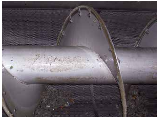
Siebgutschonende Zwangsreinigung der radialen Siebfläche.

Die HUBER Siebanlage ROTAMAT® RoK1 ist für derartige Maßnahmen bestens geeignet und wird erfolgreich im Rahmen von Sanierungs- und Neubaumaßnahmen an Regenauslässen eingesetzt. Die Siebanlage gehört zu den Feinstsieben und ist insbesondere auch für große Durchflussmengen bei einem äußerst niedrigen, hydraulischen Widerstand konzipiert. Die zweidimensionale Siebung garantiert einen sehr hohen Feststoffrückhalt in Verbindung mit einer automatischen, siebgutschonenden Zwangsreinigung der Siebfläche.