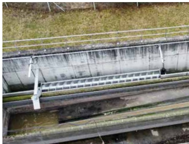
HUBER Siebanlage ROTAMAT® RoK1 TS mit einer Querförderschnecke für hohe Rechengutfrachten.