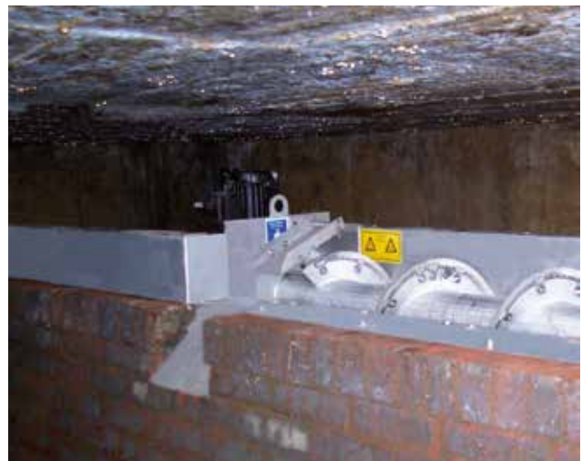
Standardmäßige Siebgutrückführung in den Abwasserkanal mit einer Auswerferklappe.

Die Siebanlage ist unmittelbar nach der Überlaufschwelle des Entlastungsbauwerkes horizontal angeordnet und besteht aus einer 180° gewölbten Siebfläche mit integrierter Schneckenwendel. Für die Dauer eines Entlastungsereignisses wird die Siebanlage von oben nach unten durchströmt und die Feststoffe zurückgehalten. Diese werden durch eine Schneckenwendel mit Bürstenbesatz während der automatischen Zwangsreinigung der Siebfläche verpressungsfrei und schonend zur seitlichen Auswurfvorrichtung transportiert und in den weiterführenden Abwasserstrom zurückgeführt. Alternativ kann das Rchengut mit einer Querförderschnecke aus der Siebanlage abgezogen und an einen weiteren Entsorgungspunkt gefördert werden. Während des Entlastungsereignisses aktiviert sich die Siebanlage selbstständig und arbeitet vollautomatisch.