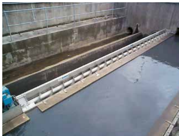
HUBER Siebanlage ROTAMAT® RoK1 an einem Abschlagsbauwerk.