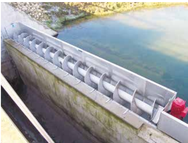
HUBER Siebanlage ROTAMAT® RoK1 an einer Entlastungsschwelle.

Überzeugen Sie sich von der HUBER Siebanlage ROTAMAT® RoK1 anhand der untenstehenden Anwendungsbeispiele.