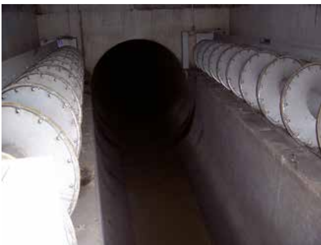
Ausrüstung eines beidseitigen Überlaufes mit HUBER Siebanlagen ROTAMAT® RoK1 60°.