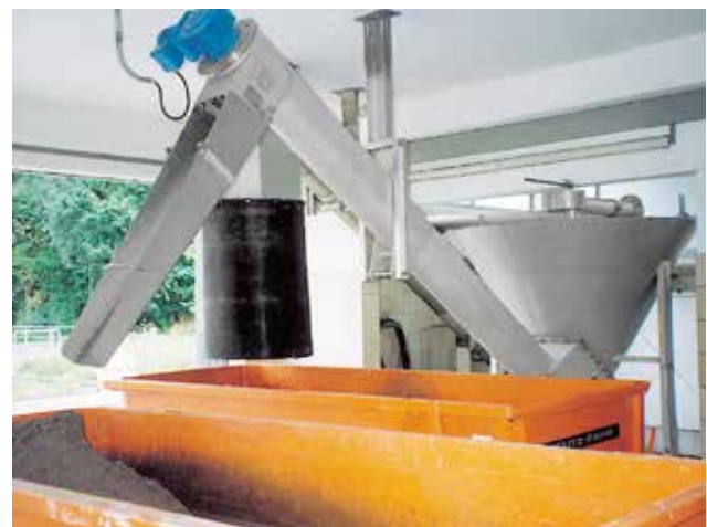
Eine Klassierschnecke transportiert das abgeschiedene Sandfangmaterial aus dem Abscheideraum in den Container.