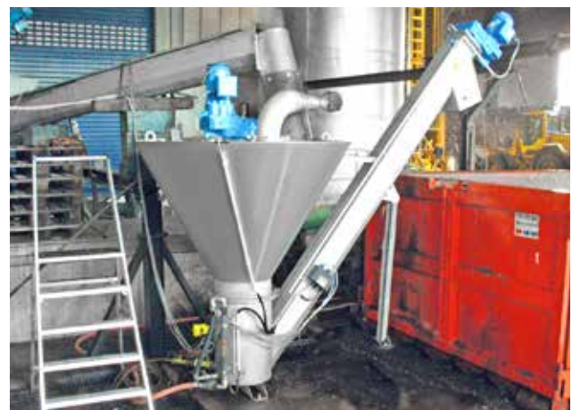
Spezielle Ausführung geeignet für die Behandlung von Sedimenten aus Biogasanlagen.