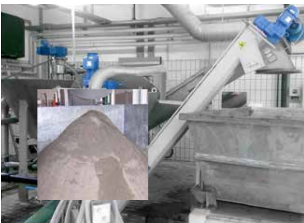
Einsatz der Sandwaschanlage auf einer kommunalen Kläranlage.