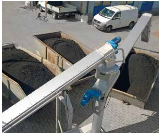
... oder in Container.