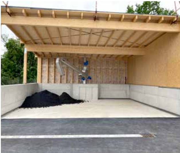
Schlammabwurf durch die Ro8 TC auf eine freie Fläche...