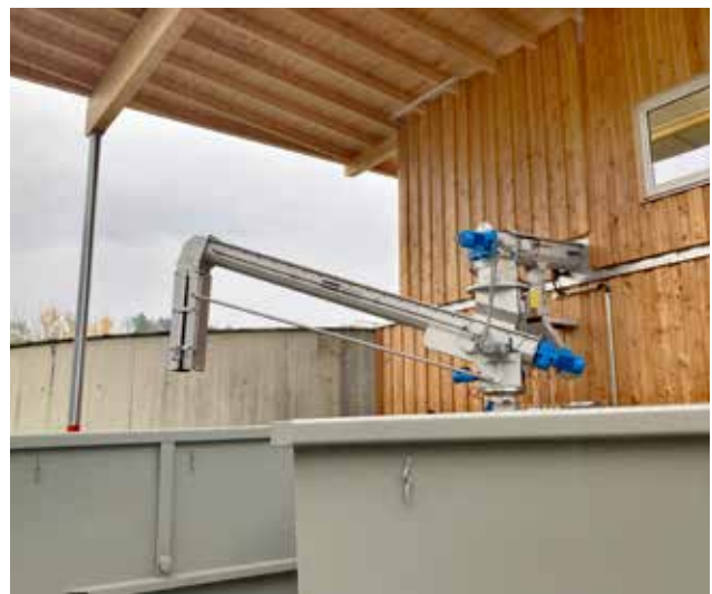
Befüllung der Container durch die Ro8 TC mit automatischer Rutsche und automatischem Schwenkantrieb.