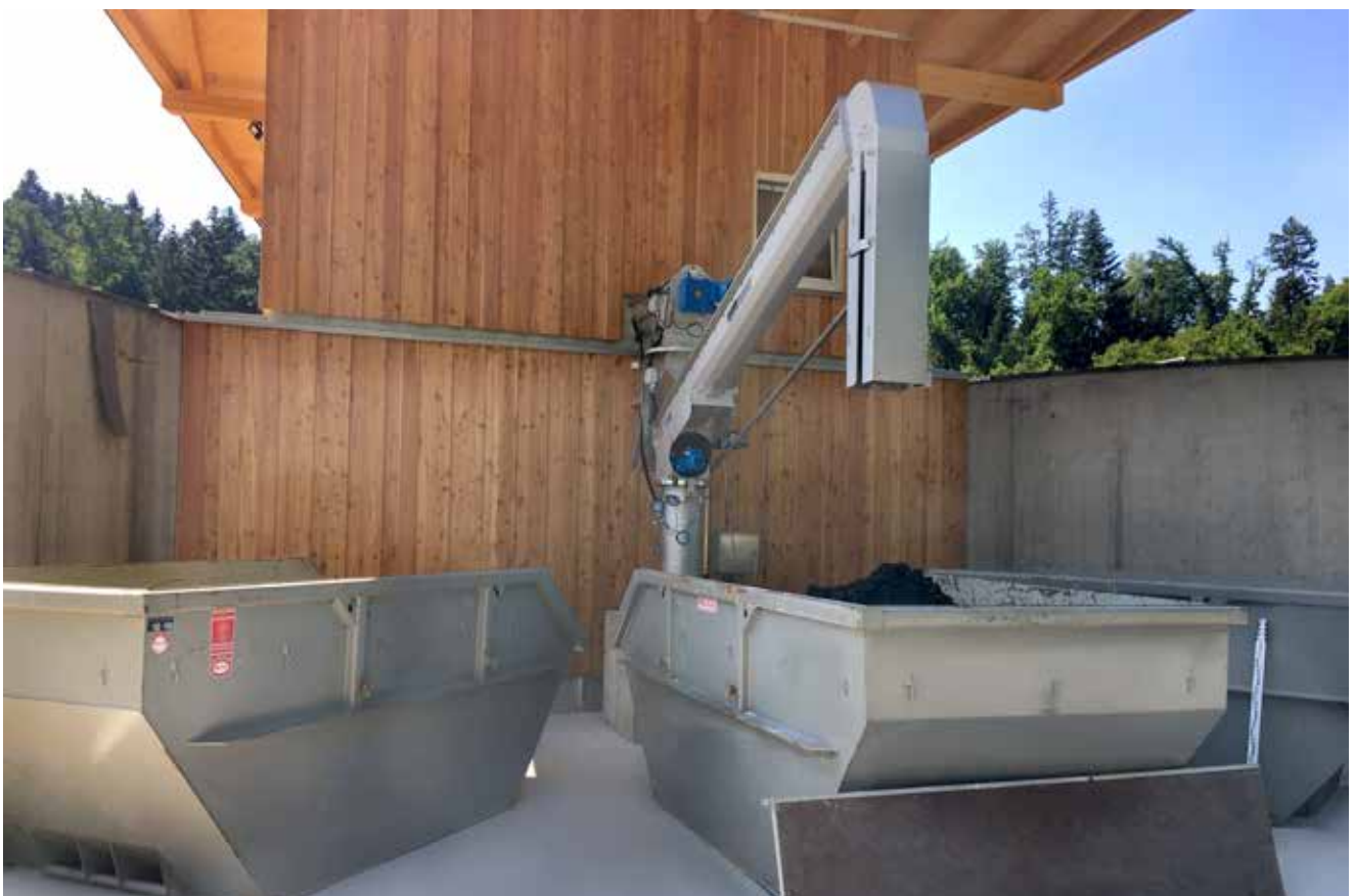
Sternförmige Anordnung der Container.

Hierbei muss platztechnisch darauf geachtet werden, dass die Container reproduzierbar auf die gleiche Stelle abgelassen werden. Einfache Markierungen am Boden sind dabei ausreichend.