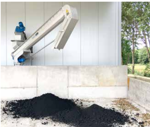
Anfahrtsschutz vor der HUBER Trogförderschnecke Ro8 TC.