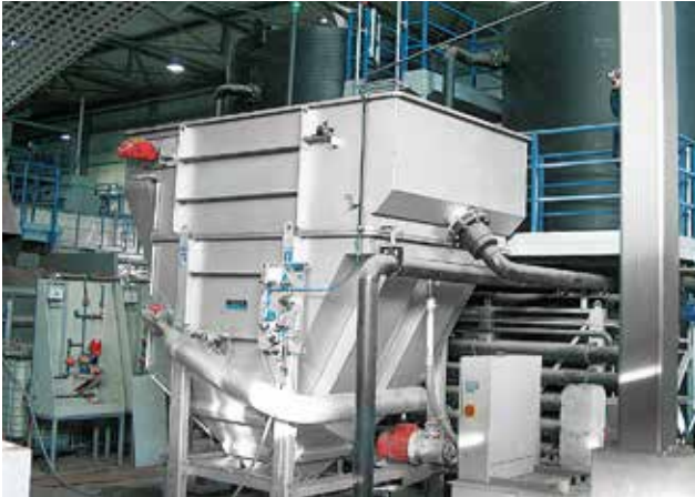
HUBER Druckentspannungsflotation HDF bei einer Lebensmittelrestaufbereitungsanlage in Spanien.

Weltweit mehr als 60 Referenzanlagen in der (Bio-) Müllaufbereitung: