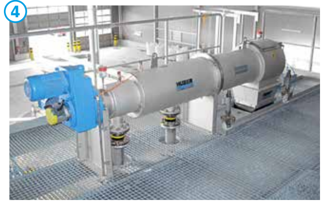
HUBER Fremdstoffabscheider STRAINPRESS®.

Jedoch müssen die gesetzlichen Vorschriften eingehalten werden, damit das Gärprodukt beispielsweise auf landwirtschaftliche Anbauflächen ausgebracht werden kann. Die Lösung hierfür ist der HUBER Fremdstoffabscheider STRAINPRESS® (Nr. 4), der gezielt die Fremdstoffe wie Kunststoffpartikel abscheidet und gleichzeitig kostenreduzierend entwässert.