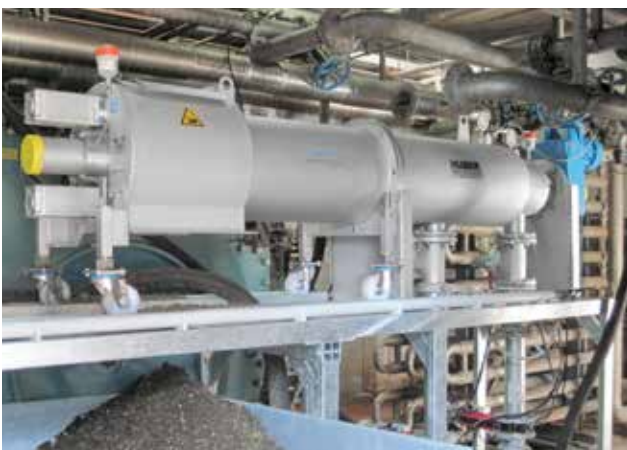
HUBER Fremdstoffabscheider STRAINPRESS® in die Rohrleitung integriert (Großbritannien).