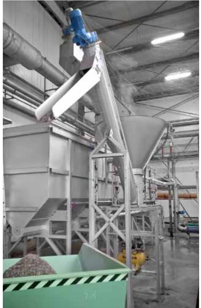
HUBER Sandwaschanlage RoSF G4E Bio bei einer deutschen Biomüllaufbereitungsanlage.