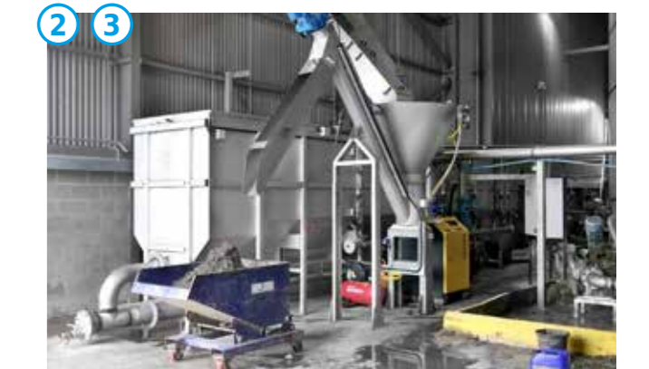
HUBER Langsandfang ROTAMAT® Ro6 Bio und HUBER Sandwaschanlage RoSF G4E Bio.

Des Weiteren zeichnet sich der kompakte HUBER Langsandfang durch eine einfache Integrierbarkeit in die bestehende Rohrleitung aus.