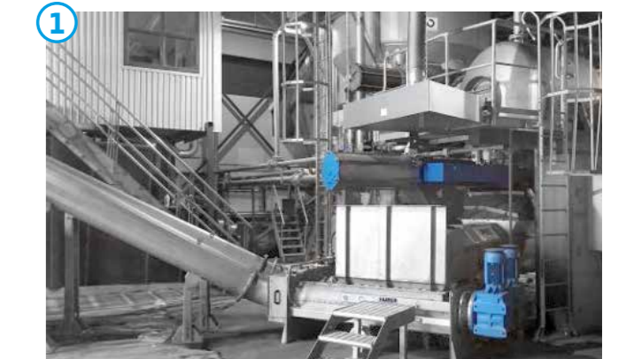
HUBER Waschpresse WAP®.

Durch die HUBER Waschpresse WAP® (Nr. 1) wird der an den Grobstoffen anhaftende Organikanteil zurückgewonnen und der Suspension zurückgeführt. Darüber hinaus kompaktiert die HUBER Waschpresse WAP® die Grobstoffe, die somit kostengünstiger entsorgt werden können.