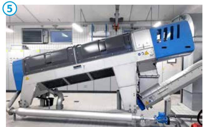
HUBER Schneckenpresse Q-PRESS®.

Die HUBER Schneckenpresse Q-PRESS® (Nr. 5) entwässert das Gärprodukt und reduziert die Lager- sowie Transportkosten auf ein Minimum. Der vollautomatische Schneckenantrieb zeichnet sich durch eine sehr niedrige Drehzahl respektive höchste Energieeffizienz und geringsten Wartungsaufwand aus.