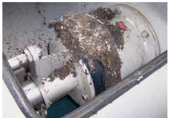
Abgeschiedene und entwässerte Fremdstoffe der HUBER STRAINPRESS® bei einer biologischen Abfallbehandlungsanlage in Deutschland.