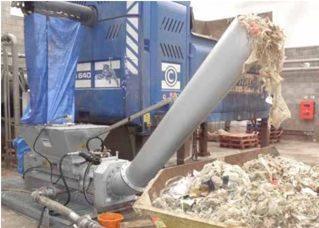
HUBER Waschpresse WAP® bei einer englischen Biomüllaufbereitungsanlage.