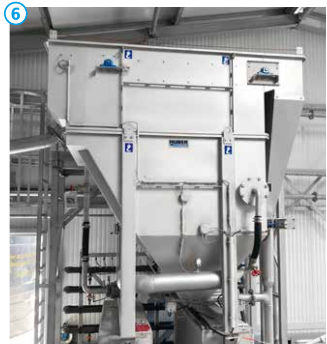
HUBER Druckentspannungsflotation HDF.

Der Flotatschlamm aus der Druckentspannungsflotation enthält wertvolle organische Inhaltstoffe, die zur Biogasproduktion wiederverwendet werden.