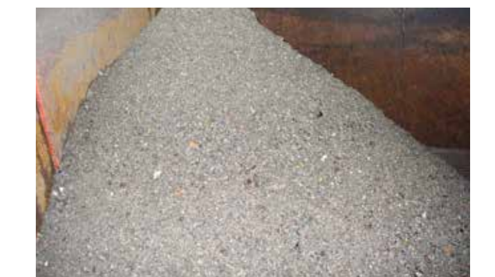
Austrag der HUBER Sandwaschanlage RoSF G4E Bio: Gewaschene mineralische Störstoffe.

Die Rückgewinnung der an den Störstoffen anhaftenden Organik erfolgt durch die HUBER Sandwaschanlage RoSF G4E Bio (Nr. 3). Die Organik wird dem Prozess zur Biogasproduktion zurückgeführt. Die gewaschenen Störstoffe können zum Beispiel zur Rekultivierung gewinnbringend verkauft werden. Zudem reduziert die integrierte Entwässerungseinheit die Transportkosten der Störstoffe signifikant.